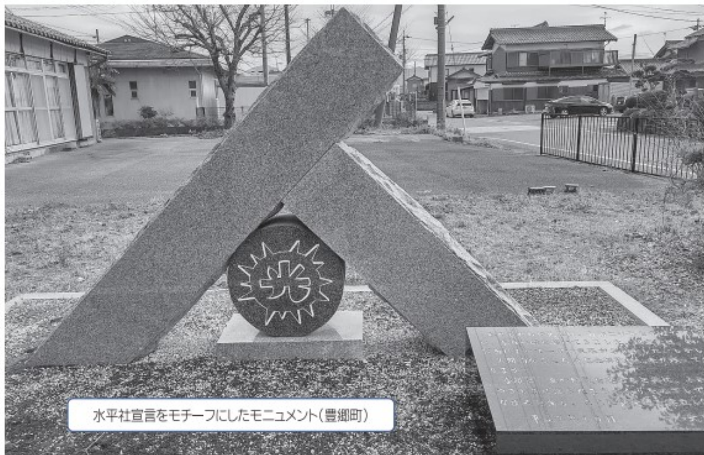
水平社宣言をモチーフにしたモニュメント(豊郷町)

「わたしたちの先輩は自由と平等を求めて闘い、今日の礎を築いてきました」と、モニュメントには刻まれています。1922年3月3日、全国水平社創立から100年を迎えました。日本初の人権宣言と言われる水平社宣言には、「人間を尊敬することによって、差別をなくす」という崇高な思いが込められています。差別をなくすために立ちあがった当時の人々の熱や思いを今一度振り返り、現代社会を生きる自分自身を問い直したいと思います。